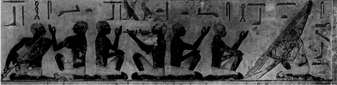
Ausschnitt aus einer Grabmalerei der Nekropole von Saqqârah, die sich heute im Museum Kairo befindet.

Die Illustration vom Grab des Nenneftka aus der Totenstätte von Saqqârah, zeigt ein recht großes Ensemble von Musikern, mit einem Flötisten, einer Form der Klarinette und einem Harfenisten, wobei jeder Musiker einem oder zwei weiteren Figuren ohne eigenes Instrument gegenübersteht. Oben im Bildausschnitt befindet sich eine Hieroglyphenzeile, die die einzelnen Instrumente ausweist. Etliche Forscher haben versucht, solche Bilder als Grundlage für Messungen zu nehmen und antike Instrumente auf diese Weise zu rekonstruieren, um so einen Einblick in das unterliegende Musiksystem zu gewinnen. Solchen Bemühungen macht jedoch in der Regel der hohe Grad der Stilisierung, der in der ägyptischen Malerei üblich ist, einen Strich durch die Rechnung. Andere haben einen eher holistischen Interpretationsansatz gewählt und sind zu dem Schluss gelangt, dass die ägyptische Musik — im Gegensatz zur griechischen — vermutlich eine Form der Mehrstimmigkeit kannte. So bemerkte Kiesewetter etwa, dass in verschiedenen Darstellungen der Harfenist mehr als eine Saite zupft und mutmaßt, dass die ägyptische Musik akkordlich aufgebaut sein musste. 28